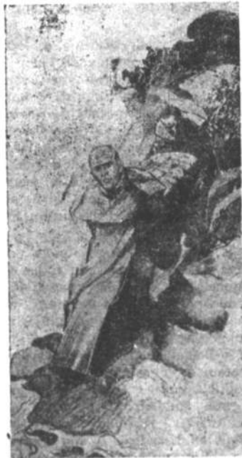
O fardo macabro

Seputados a grande profundidade encontrou-se muitos cadáveres sobre os quaes a pericia medica achou traços de venenos. Dobaixo dos assoalhos, nas cellas, além de fortes quantias de dinheiro, acharam-se em grande quantidade armas e munições.